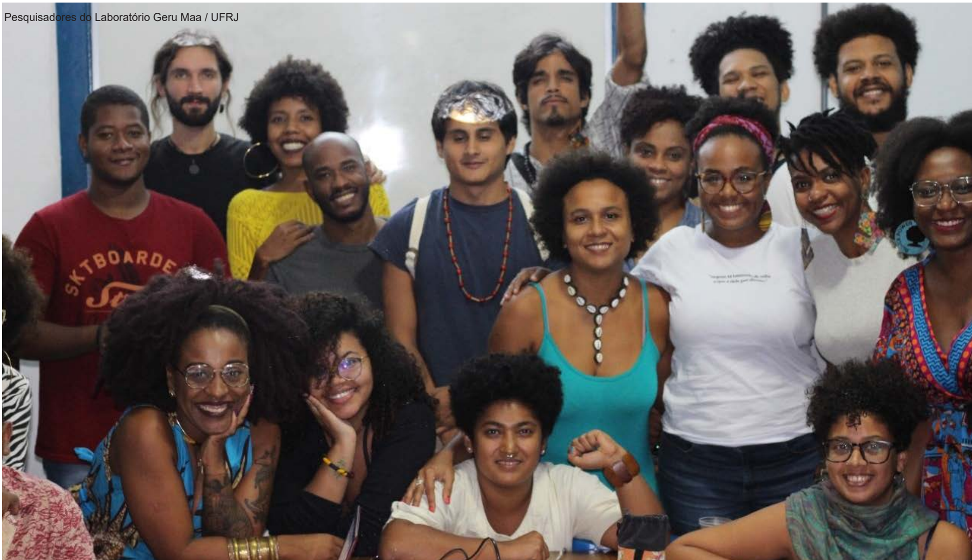
Pesquisadores do Laboratório Geru Maa / UFRJ

"Os fazendeiros vem desmatando e derrubando nossa floresta. Eles não conhecem que existe arvore venenosa que mata gente. A sociedade não indígena não conhece as florestas. As fumaças, os gases vem lá de cima e cai aqui em baixo, matando a gente aqui na terra."