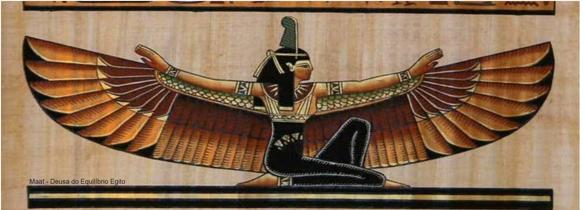
Maat - Deusa do Equilíbrio Egito