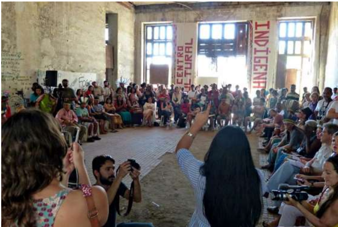
Reunião comunidade indígena e autoridades de Estado Aldeia Maracanã - 2018

manifestação, eleição, votar, associar, cultivar seu credo, sem discriminação de raça, cor, portador de deficiência, gênero, número, grau. Na prática, a equidade, igualdade, liberdade, não foi dada ao povo negro e indígena, pois, continuam sendo preteridos nos altos escalões do governo, empresas, universidades, nos melhores empregos apesar da política de quotas.