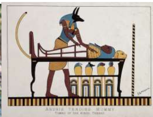
Imagem: Deus egípcio - Anúbis