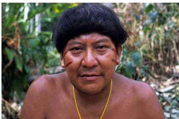
Davi Kopenawa