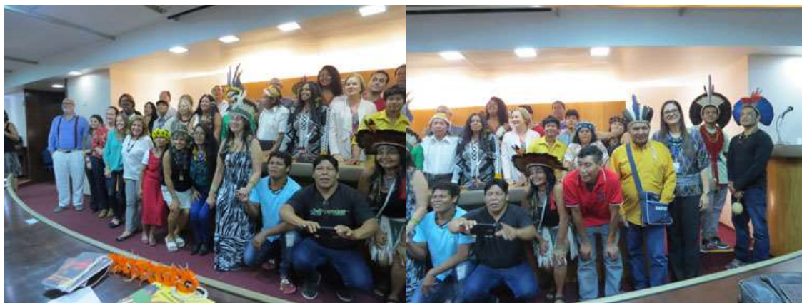
Foto: Posse do CEDIND

dentre elas: A criação do CEDIND (Conselho Estadual dos Direitos Indígenas) órgão paritário governo e sociedade civil; a sua não demolição para criação de uma garagem para atender um Shopping Center e a possibilidade da Criação de Um Centro de Referência/Universidade Indígena.