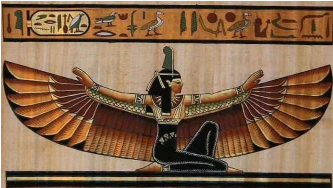
Foto: Deusa Maat

orçamentário; Além do diálogo com as autoridades, movimentos sociais para tratar de questões que digam respeito a cultura e identidade ameríndia. O CEDIND, já está em elaboração de calendário de reunião para tratar de assuntos diversos, uma delas é “Aldeia Maracanã”, bem como: a criação de um Centro de Convivência/Universidade Indígena. Esperamos com esse artigo, fomentar a discussão na valorização da nossa cultura, trazendo Maat, deusa da equidade africana e Xapiri, o encantado da floresta, para pensarmos na nossa realidade, partindo da ideia de Asante: “a ideia relacional africana fundamental, funciona para criar uma sociedade humana não dominadora e não combativa”. Assim Maat, significa: “a verdade, justiça, ordem, equilíbrio, harmonia e reciprocidade”. E eles servem apenas para indicar possibilidades de os outros tenham construções semelhantes. O espírito de Xapiri, o encantado da floresta na “Casa Grande Aldeia Maracanã”, vem ao encontro dos ancestrais, que luta para fazer justiça a memória ancestral. Segundo Kopenawa: “Na floresta, a ecologia somos nós, os humanos. Mas também, tanto quanto nós, os xapiri, os animais, as árvores, os rios, os peixes, o céu, a chuva, o vento e o sol. É tudo o que veio a existência na floresta, longe dos brancos; tudo o que ainda não tem cerca”.