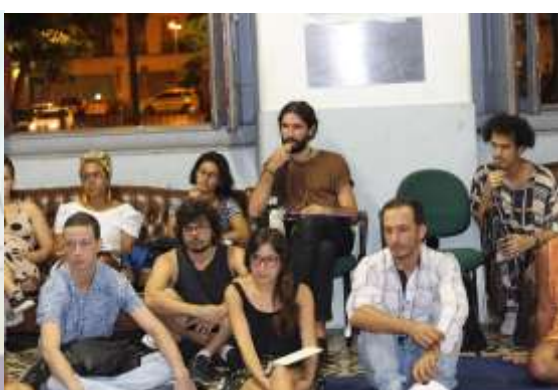
Temática Indígena IFCS / UFRJ